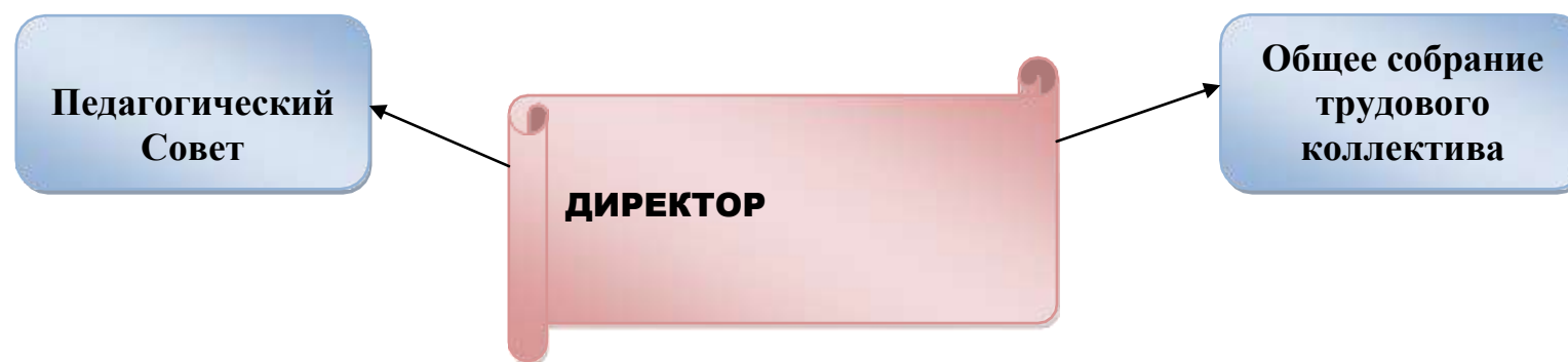
Схема системы управления МБОУ «Пригородная СОШ»