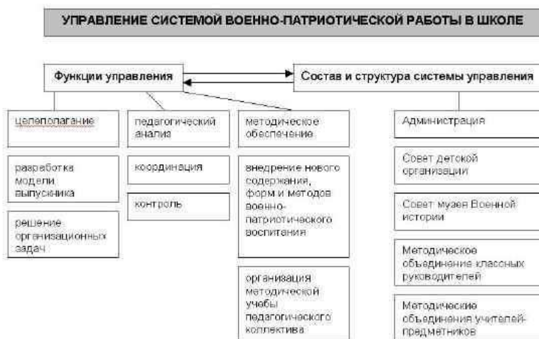
Рисунок 2. Управление системой военно-патриотической работы в школе

воспитания, так и изменениями, происходящими в экономической, политической, социальной и других сферах российского общества, а также новыми условиями современного мира, что обуславливает гибкость в управлении системой военно-патриотического воспитания в школе (рис. 2).